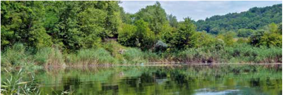
Lebensraum der Europäischen Sumpfschildkröte in der Schweiz im Schutzgebiet Moulin-de-Vert (Genf)

Auf den Roten Listen der gefährdeten Reptilien der Schweiz von 1982 beziehungsweise 1994 wird die Europäische Sumpfschildkröte als „ausgestorben“ taxiert, bis sich Ende der 1990er-Jahre Hinweise darauf verdichteten, dass möglicherweise noch autochthone Vorkommen an einigen Standorten in der Schweiz existieren. In der Roten Liste von 2005 wurde die Art folglich als „vom Aussterben bedroht“ („critically endangered“) eingestuft.