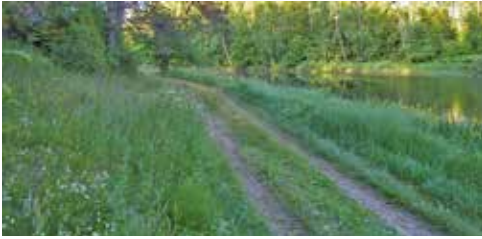
Gelegentlich als Eiablageplatz genutzte Fahrspuren führen meist zum Totalausfall

Schwerwiegend wirkte sich der Nutzungswandel im Zuge der Industrialisierung der Land- und Forstwirtschaft in der 2. Hälfte des 20. Jahrhunderts aus. Historische Nutzungsformen wie die Waldhutung und die Beweidung der schwer zu bewirtschaftenden Endmoränenhügel oder nährstoffarmer Sander wurden aufgegeben. Nach und nach wichen die extensiv genutzten Wiesen und Trockenrasen und damit