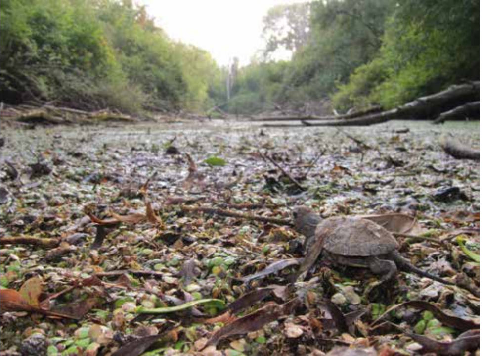
Ein Schlüpfing verlässt seine Gelegehöhle im Nationalpark Donau-Auen