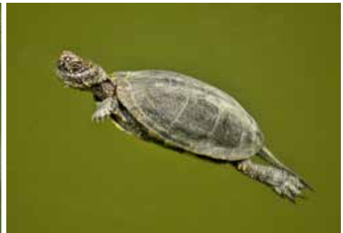
Emys orbicularis hellenica vom Balkan