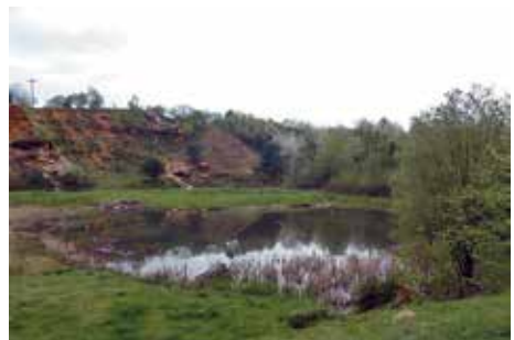
Wiederansiedlungsgebiet „Hölle von Rockenberg“ in der Wetterau, Hessen

Schon lange sind die historischen Vorkommen Europäischer Sumpfschildkröten in Deutschland mit wenigen Ausnahmen erloschen. Freilandstudien zeigten in den 1990er-Jahren für die Brandenburger Reliktpopulationen einen kritischen Zustand. Zur Rettung der überalterten und individuenarmen Populationen war ihre Stützung mit künstlich erbrüteten Gelegen unverzichtbar. Inzwischen stehen für Bestandsstützungen und Wiederansiedlungsvorhaben in Nordostdeutschland Nachkommen einer Erhaltungszucht,