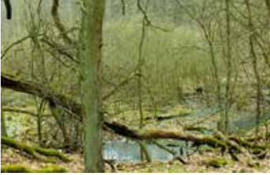
Überwinterungsgewässer von E. orbicularis