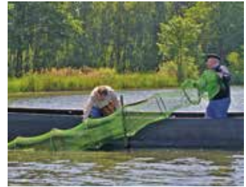
Die Reusenfischerei ist eine potenzielle Gefahr für die Schildkröten

auch in Nordostdeutschland erheblich durch den Fang zu Speisezwecken dezimiert beziehungsweise sogar ausgerottet wurden. Heute unvorstellbar – da die katholische Kirche in der Fastenzeit den Verzehr von den im Wasser lebenden Schildkröten (die folglich „Fisch“ sind) erlaubte, gab es noch vor 300 Jahren in Preußen eine gewerbsmäßige Ausbeutung und einen schwunghaften Export der damals häufigen Europäischen Sumpfschildkröten als Fastenspeise!