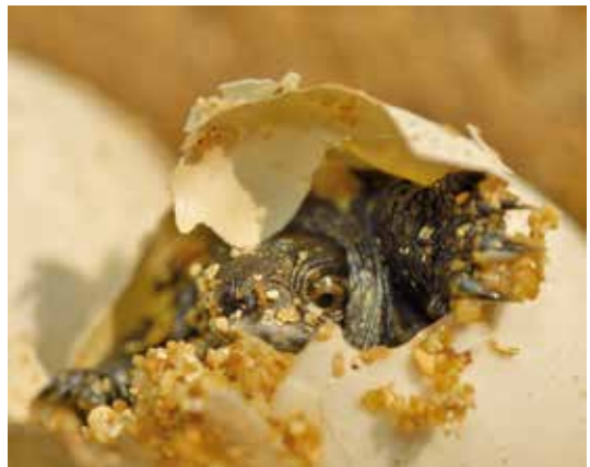
Schlupf einer kleinen Europäischen Sumpfschildkröte

Im gesamten Verbreitungsgebiet scheint es zwei verschiedene Schlupfstrategien der Jungtiere zu geben: Entweder verlassen die kleinen Schildkröten schon im September desselben Jahres die Nesthöhle oder sie überwintern, bereits geschlüpft, in der Gelegegrube und verlassen diese erst im Frühjahr des darauffolgenden Jahres. Liegen die Eiablagestellen der Weibchen weit vom Gewässer entfernt, kann man die Jungtiere nach dem Schlupf ebenfalls auf erstaunlich weiten Überlandwanderungen antreffen.