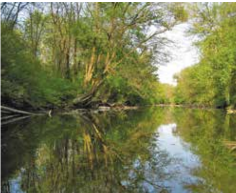
Dieser Altarm im Nationalpark Donau-Auen (Tiergartenarm) ist ein idealer Lebensraum für Europäische Sumpfschildkröten