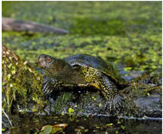
Die Europäische Sumpfschildkröte erfreut sich auch in der Bevölkerung einer gewissen Popularität

Im Gegensatz zu anderen Reptilienarten erfreut sich die Europäische Sumpfschildkröte in der Bevölkerung einer gewissen Popularität und stößt bei einem weiten Kreis von Schildkrötenhaltern auf großes Interesse. Entsprechend vielfältig und zahlreich waren und sind denn auch die Bestrebungen, diese attraktive Schildkröte in verschiedenen Gewässerkomplexen anzusiedeln oder wiederanzusiedeln. Grundsätzlich begrüßt die Karch diese Bemühungen, setzt sich aber vehement dafür ein: