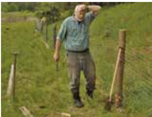
Einzäunen des Eiablageplatzes

plätze beispielsweise in Brandenburg seit Jahren während der Eiablagessaison aus größerer Distanz von erfahrenen Mitarbeitern des Schutzprojekts beobachtet. Sofern der gesamte Gelegeplatz (größere Fläche mit mehreren Gelegen) eingezäunt wird, ist der Zaun so zu stellen, dass die Schildkrötenweibchen ungehinderten Zugang haben. Letzteres ist alljährlich zu prüfen und gegebenenfalls nachzubessern. Die Einzäunung des Gelegeplatzes ist nicht grundsätzlich zu empfehlen und kann auch nachteilige Effekte (siehe unten) hervorrufen. Sie schützt die Nester vor allem vor Wildschweinen. Fuchs, Marder, Waschbär und eventuell weitere Arten finden trotzdem Zugang. Es empfiehlt sich daher auch bei eingezäunten Gelegeplätzen, Einzelgelege mit Maschendraht zu sichern. Ein nachteiliger Effekt der Einzäunungen ist die ungehinderte Entwicklung der Vegetation. Der fehlende Zugang äsender