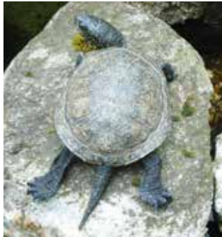
Charakteristisch für E. orbicularis ist der lange Schwanz