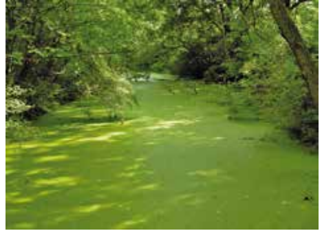
Altarm im Nationalpark Donau-Auen (Fadenbach)

Regelmäßig werden zweifelhafte Angaben über das Vorkommen von Europäischen Sumpfschildkröten aus verschiedenen Bundesländern gemacht, selbst im alpinen Bereich. Jüngst durchgeführte Untersuchungen an Europäischen Sumpfschildkröten in Vorarlberg, wo Reliktvorkommen erwartet werden könnten, ergaben jedenfalls, dass die Art dort heute als ausgestorben gelten muss. Auch Einzelexemplare aus Kärnten erwiesen sich nach neueren molekulargenetischen Untersuchungen als gebietsfremd (allochthon). Trotzdem kann ein natürliches Vorkommen außerhalb der Donau-Auen im Burgenland, in der Südsteiermark sowie in Südkärnten nicht ausgeschlossen werden,