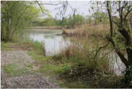
Ein Wiederansiedlungsgebiet in den Rheinauen

meist Tiere des Haplotyps IIa, der eine weite geographische Verbreitung von Mittelfrankreich bis zur Donau-Mündung hat. Selbst unter der Voraussetzung, dass die Zuchttiere ausschließlich aus dem relativ großen Verbreitungsgebiet dieses Haplotyps stammen, existieren ihre nächsten natürlichen und stabilen Populationen erst in Ungarn, Kroatien und Slowenien oder in Mittelfrankreich! Grundsätzlich ist nach dem gültigen Naturschutzrecht für das Aussetzen von Tieren, so auch bei Wieder-