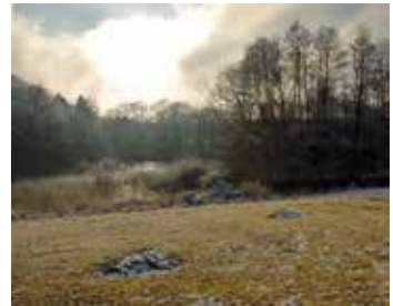
Eine Abdeckung der Nester mit Nadelbaumreisig schützt vor Frostschäden

In Mitteleuropa überdauern die Schlüpflinge ihren ersten Winter oft in den Nesthöhlen. In dieser Zeit können harte Fröste ohne Schnee (Kahlfröste) den gesamten Reproduktionserfolg der Saison zunichte machen. Es empfiehlt sich daher, die Nester von Mitte November bis etwa Mitte März des Folgejahres mit einer dicken Packung Nadelbaumreisig (Kiefer oder Fichte) abzudecken.