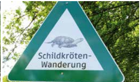
Hinweisschild zum Schutz der Tiere vor dem Überfahrenwerden bei der Querung von Straßen

Der Ausbau des Straßennetzes, steigende Verkehrsdichten und die Erschließung der Wälder und Agrarflächen mit einem zunehmend ausgebauten Wegenetz können den Verbund der Teillebensräume von Sumpfschildkrötenvorkommen erheblich beeinträchtigen. Ein dichtes Verkehrsnetz, hohe Verkehrsdichten, Siedlungen und