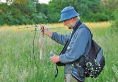
Auf der Suche nach besonderen Tieren – Telemetrie

Aussagen zum Zustand der Sumpfschildkrötenpopulationen sind nur auf der Grundlage quantitativer Daten möglich. Die Bestandserfassung und das Populationsmonitoring bilden die Basis, um den Zustand einer Population und somit den Erfolg der Schutzmaßnahmen einzuschätzen. Nach der Fauna-Flora-Habitat-Richtlinie sind die Länder der Europäischen Union verpflichtet, eine langfristige Bestandsüberwachung für Arten von gemeinschaftlichem Interesse durchzuführen.