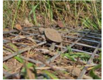
Abdeckung der Nester mit Drahtgitter

Die Abwehr von Prädatoren beginnt an den Schildkrötengelegen. Hierfür empfiehlt sich die Abdeckung der Nester mit Maschendraht oder einem Gitter in einer Größe von mindestens 60 x 60 cm (Maschenweite ca. 3 cm). Der Maschendraht wird mit mehreren mindestens 40 cm langen Erdnägeln am Boden befestigt. Kurz nach der Eiablage haben sich zur Abwehr von Prädatoren auch intensive Geruchsstoffe (zum Beispiel Mückenspray) im Umfeld des Nestes bewährt. Voraussetzung für den Schutz der Gelege ist die Kenntnis ihrer Standorte. Zu diesem Zweck werden die Gelege-