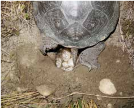
Ein Weibchen bei der Eiablage

Der Beginn der Eiablage ist fast im gesamten europäischen Verbreitungsgebiet erstaunlich konstant, wobei in Mittel- und Osteuropa meist nur ein Gelege, im Süden des Verbreitungsgebiets aber bis zu drei Gelege abgesetzt werden können.