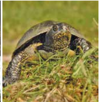
Weibliches Tier aus Brandenburg

Wie bereits ausgeführt, sind die Europäischen Sumpfschildkröten im Süden mit Panzerlängen von höchstens 15 cm recht klein. Manche Populationen im östlichen Mittelmeergebiet sind geradezu zwergwüchsig, und die Schildkröten können dort unter 10–12 cm Panzerlänge bleiben. Im Norden und Osten des riesigen Verbreitungsgebiets sind Europäische Sumpfschildkröten grundsätzlich viel größer als im Süden und können Panzerlängen von maximal 23 cm erreichen. Tiere aus dem Süden wiegen in der Regel weniger als 500 g; im Norden und Osten werden sie der größeren Panzerlänge entsprechend viel schwerer, wobei Männchen in der Regel unter 1 kg bleiben. Weibchen können ohne weiteres 1,5 kg Körpermasse übertreffen. Hinsichtlich der Färbung und Zeichnung sind Europäische Sumpfschildkröten ebenfalls recht variabel. Tiere aus nördlichen Vorkommen sind immer ziemlich dunkel gefärbt, und der Bauchpanzer kann fast einfarbig schwarz sein. Im Süden kommen ebenfalls dunkle Exemplare vor, wobei der Bauchpanzer meist gelblich gefärbt ist, aber auch ausgesprochen helle Tiere oder Exemplare mit einem in der Grundfarbe gelblichen bis einfarbig beigen Rückenpanzer.