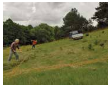
Schonende Mahd des Gelegehügels

Als Gelegeplatz nutzen Europäische Sumpfschildkröten mikroklimatisch günstige Flächen, im Ideal-