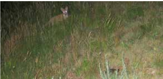
Ein wichtiger Fressfeind von Emys orbicularis (im Vordergrund): der Fuchs

Für Europäische Sumpfschildkröten ist eine Vielzahl von Fressfeinden bekannt. Tatsächlich werden die meisten Gelege geplündert, und nur ein kleiner Teil der geschlüpften Jungtiere erreicht das Erwachsenenalter. Dafür sorgen vor allem Wildschweine, Füchse, Dachse, Marder, diverse Vögel (unter anderem Reiher, Störche, Krähen) und im Süden des Verbreitungs-