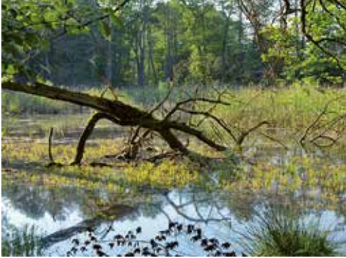
Idealer Lebensraum: strukturierte Gewässer- und deckungsreiche Uferpartien

Pflegemaßnahmen in Sumpfschildkrötengewässern, wie beispielsweise die Entnahme von Vegetation (zum Beispiel Breitblättriger Rohrkolben) sind ebenfalls mit äußerster Vorsicht, möglichst manuell vorzunehmen. Nur auf diese Weise kann eine erhebliche Störung oder gar Verletzung von Tieren ausgeschlossen werden.