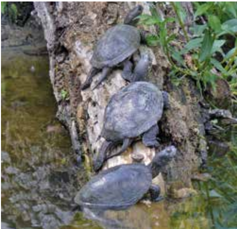
Emys orbicularis im natürlichen Lebensraum

In den nördlicheren Teilen des europäischen Verbreitungsgebietes hält die Europäische Sumpfschildkröte eine Winterruhe, während die Tiere im Süden im Winter zwar ihre Aktivität reduzieren, aber durchaus aktiv bleiben können. Auch in Mitteleuropa kann man in milden Wintern gelegentlich aktive Tiere in Freilandanlagen beobachten. Im Süden des Verbreitungsgebiets kann es, insbesondere wenn die Wohngewässer während des Sommers austrocknen, auch zu einer Sommerruhe kommen.