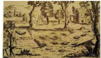
Schildkrötenteich aus HONBERG, W.H. (1682): Georgica curiosa, Aediliges Land- und Feldleben . - Ausgabe Martin Endler, 1701, Nürnberg

Noch vor wenigen Jahrhunderten war die Europäische Sumpfschildkröte in Mitteleuropa weit verbreitet. Schon prähistorisch hat sie in einigen Regionen die Nahrungspalette der Menschen bereichert. Darüber hinaus dienten ihre Panzer als Gebrauchsgegenstände und fanden unter anderem als Schüsseln oder Kehrschaufeln Verwendung. Vor allem aus dem 17. und 18. Jahrhundert belegen zahlreiche Quellen, dass die Bestände sowohl im süddeutschen Raum als