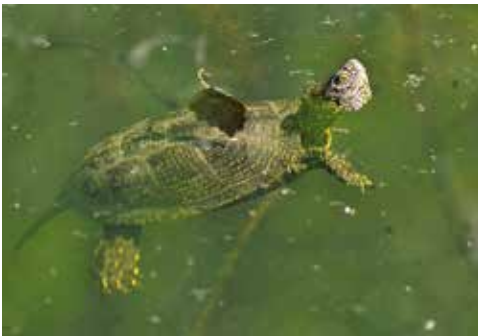
E. o. orbicularis (Verbreitungsgebiet Haplotyp IIa)

Tatsächlich ist die Informations- und Indizienlage rund um das Vorkommen der Europäischen Sumpfschildkröte in der Schweiz verworren, und auch historische faunistische Quellen zeichnen diesbezüglich kein klares Bild. Erschwerend kommt hinzu, dass die Europäische Sumpfschildkröte möglicherweise bereits in prähistorischer Zeit, sicher aber im Mittelalter als Handelsware – sie galten als Fastenpeise – in die Schweiz eingeführt und mit hoher Wahrscheinlichkeit auch freigesetzt wurde. Zusätzlich kompliziert wird eine Beurteilung der Situation heute auch durch die zwischen 1950 und 1980 an verschiedenen Orten durchgeführten