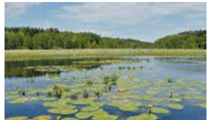
Lebensraum der Europäischen Sumpfschildkröte in Brandenburg