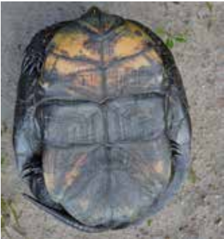
Bauchpanzer einer nördlichen E. orbicularis

Europäische Sumpfschildkröten sind morphologisch sehr variabel, zeichnen sich aber immer durch ein sogenanntes „Scharnier“ im Bauchpanzer aus, das eine lederartige Verbindung zwischen dem vorderen und hinteren Teil des Bauchpanzers darstellt. Da bei ausgewachsenen Sumpfschildkröten zudem die „Brücke“, die Verbindung zwischen Rücken- und Bauchpanzer, ebenfalls nicht verknöchert ist, erlaubt dies eine eingeschränkte Beweglichkeit der beiden Bauchpanzerteile. Dadurch können die Tiere die Panzeröffnungen etwas verkleinern, wenn sie sich bedroht fühlen. Alle Europäischen Sumpfschildkröten besitzen einen relativ langen Schwanz.