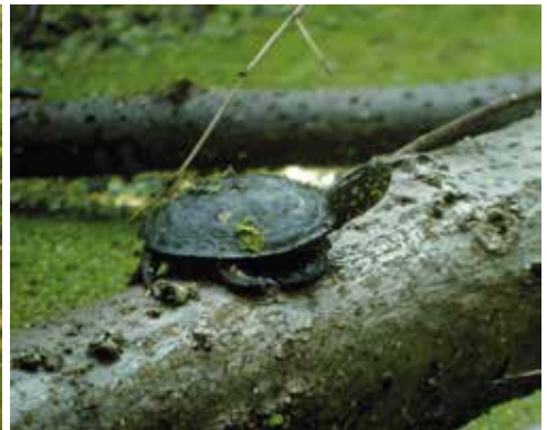
Ein Jungtier im Fadenbach (Nationalpark Donau-Auen) beugte die Umgebung