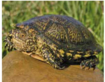
Westliche Sumpfschildkröte aus der Region Tudela (Navarra, Spanien)