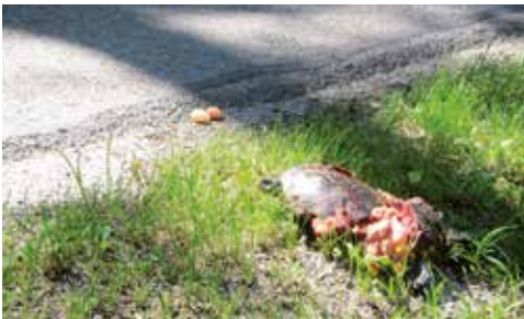
Wandernde Europäische Sumpfschildkröten werden häufig Opfer des Straßenverkehrs